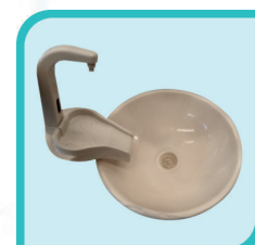
Crachoir en céramique