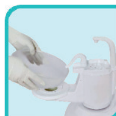
Crachoir en verre amovible