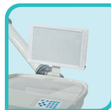
Négatoscope panoramique à LED