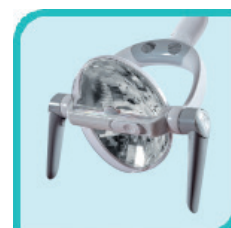
Lampe LED réfléchissante