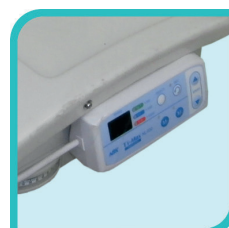
Module électronique pour micromoteur