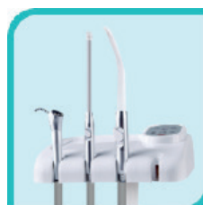
Tablette assistant avec instruments et clavier secondaire