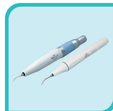
Détartreur électronique intégré