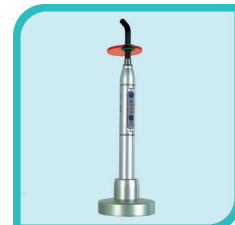
Lampe de polymérisation à LED intégrée